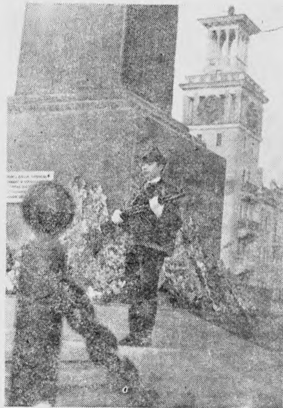
В эти предпраздничные дни особенно многолюдно на Красной площади Красноярска. У памятника павшим борцам всегда цветы: венки и живые цветы уходящей осени. А у Вечного огня в почетном карауле стоят влики тех, кто завосвывал мир и счастье для будущих поколений, кто уже никогда не встанет и не увидит нашей свободной и радостной жизни.